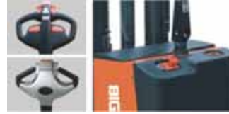
Kumanda kolu Akü Şarj göstergesi ve acil stop butonu.