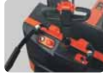
Akü Şarj göstergesi ve acil stop butonu.