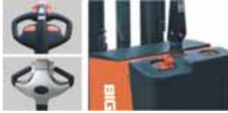
Kumanda kolu Akü Şarj göstergesi ve acil stop butonu.