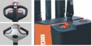
Kumanda kolu Akü Şarj göstergesi ve acil stop butonu.