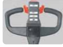
CURTIS kumanda kolu