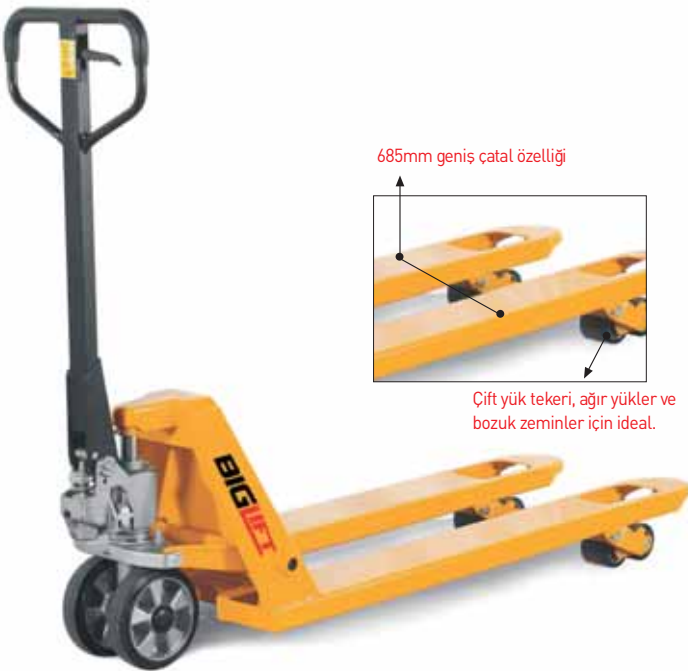
685mm geniş çatal özelliği